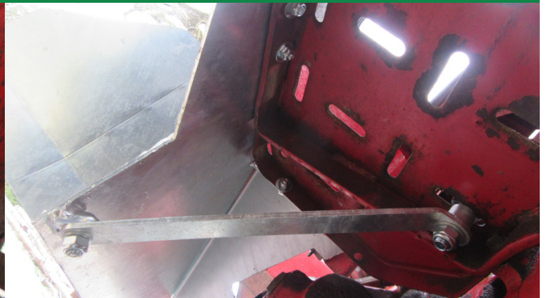
Auftritt wird mit Strebe u. Schloßschraube 12 x 50 am Trittbrett abgestützt