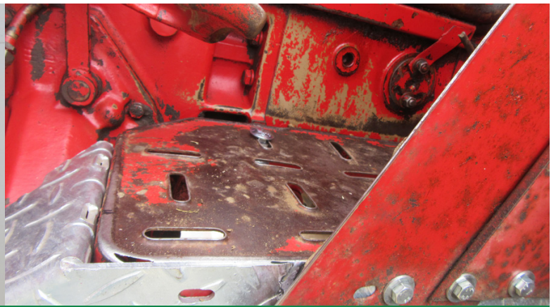
Auftritt wird mit 2 Schrauben 8 x 25 u. 4 x Beilagscheiben vorne am Trittbrett angeschraubt