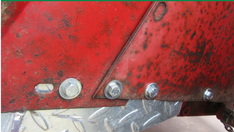
Auftritt wird seitlich am Kotflügel mit 3 Schrauben 8 x 25 u. 1 Schraube u. Beilagscheiben verschraubt