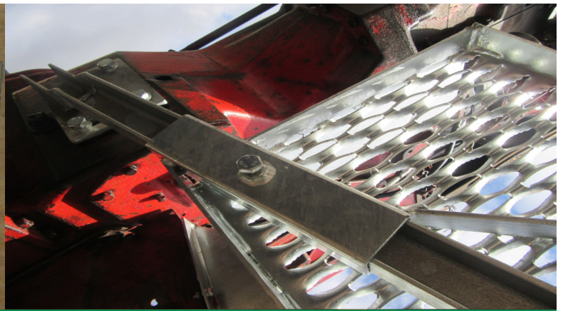
Tritthalter wird mit 3 Schrauben \frac{5}{8} \times 1\frac{1}{4} Zoll mit Sprengring am Getriebelock verschraubt