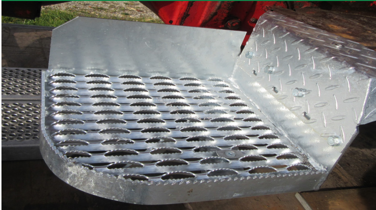
Auftritt wird mit 1 Schraube 12x50 u. Senkkopfschraube 8x35 mit Ausgleichsklammer, Rondelle u. Beilagscheibe mit dem Tritthalter verschraubt