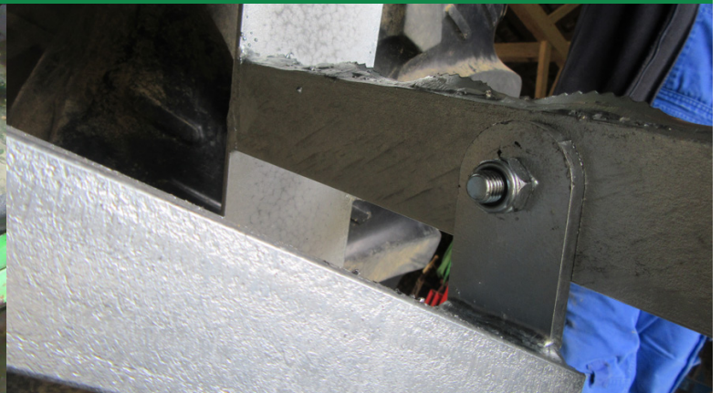
Trittleiter wird mit Schraube 12x30 mit dem Tritthalter verschraubt