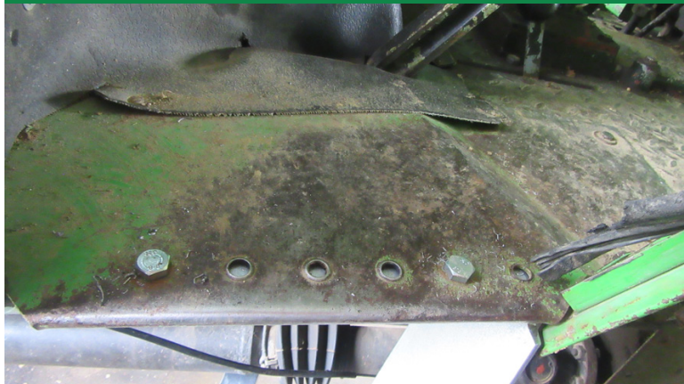
Trittleiter wird mit 2 Schrauben 12x25 mit dem Trittbrett verschweißt