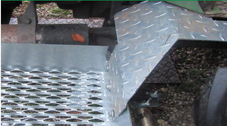
Schutzblech wird mit 3 Schrauben 8x20 am Trittbrett und mit 2 Schrauben 10x25 am Auftritt verschraubt