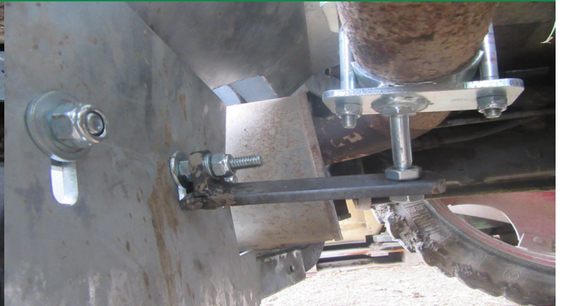
Auspuff wird mit Auspuffhalter am Auftritt verschraubt