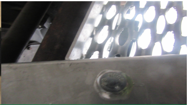
Auftritt wird mit Schraube 12x55 am Tritthalter gesichert