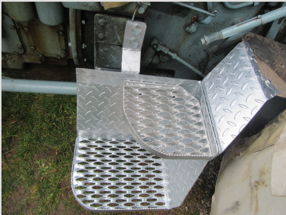
Schutzblech wird mit Trittblech des Schleppers verschraubt, Schrauben 8 x 20