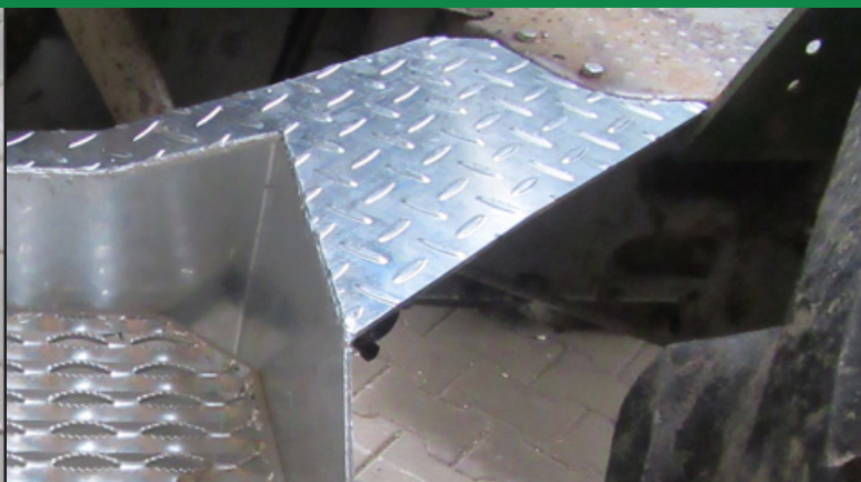
Auftritt wird mit 2 Schrauben 8 x 40 mit dem Bodenblech des Schleppers verschraubt