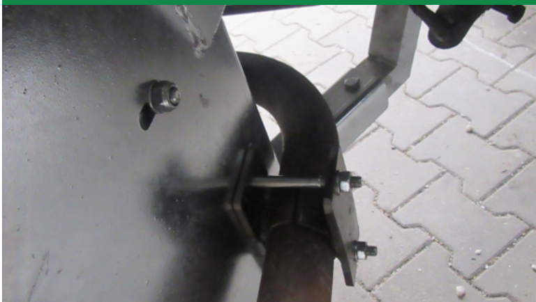
Auspuffschelle wird mit 2 Schrauben 8 x 80 befestigt