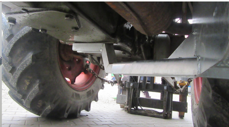
Tritthalter wird mit 2 Schrauben 14 x 25 u. 2 x Sprengring 14,5 am Getriebeblock befestigt