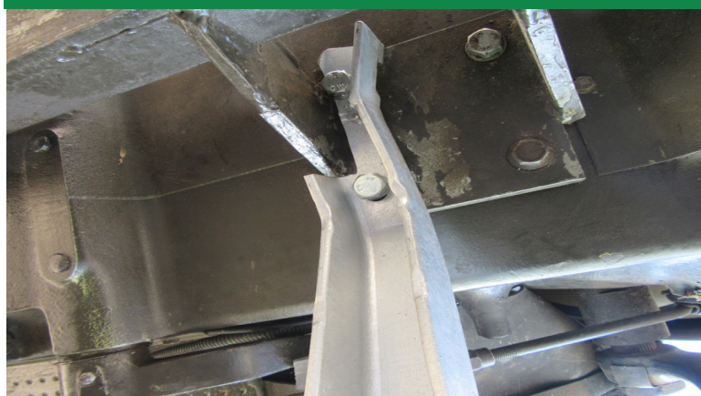
Bei Busatis Mähwerk muss der Tritthalter der Mähwerkbefestigung angepaßt werden