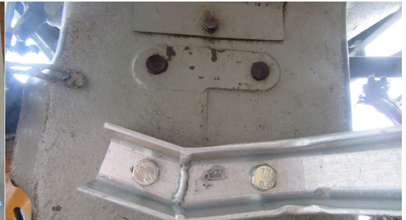
Tritthalter wird mit 2 Schrauben 12x25 mit Sprengling am Getriebekblock verschraubt