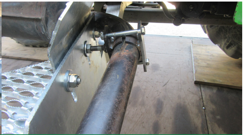
Bei Auspuff nach unten: Auspuff wird mit Schelle am Auftritt befestigt