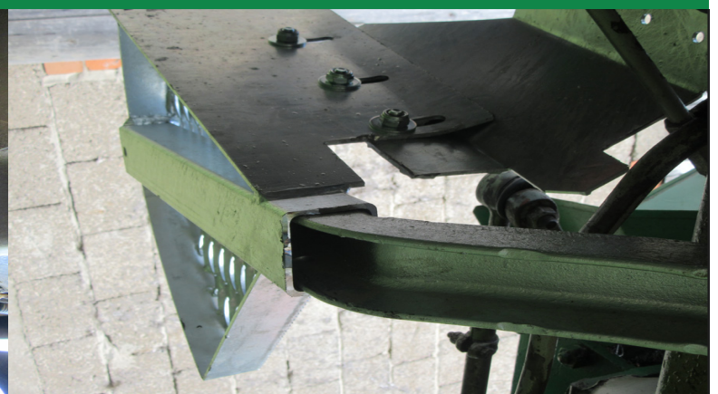
Tritthalter mit Auftritt