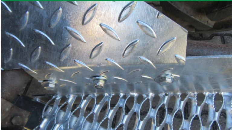
Schutzblech mit 2 Schrauben 10x25 mit dem Auftritt verschraubt - bei Auspuff nach oben 3 Schrauben