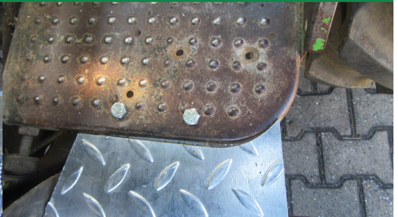
Schutzblech wird mit 2 Schrauben 8x30 mit dem Trittbrett verschraubt, Bohrungen anbringen