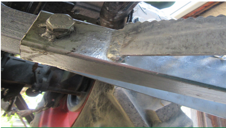
Auftritt wird mit Schraube 12x25 am Tritthalter gesichert